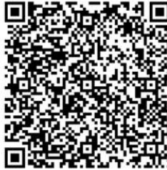
Rek. Dana Pemeliharaan BNI : 0143603483