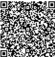
Rek. Dana Pelayanan BNI : 0076386122

Persembahan dapat di transfer melalui mobile/internet banking, ATM atau memindai dengan QR Code di bawah ini atau disetiap bangku dalam Gedung gereja. Jemaat dimohon memberikan informasi ke Kantor Majelis Jemaat GPIB Bukit Sion.