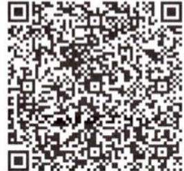
Rek. Dana Pelayanan BRI : 114201000886300

a/n PELAYANAN GPIB BUKIT SION a/n PEMELIHARAAN BUKIT SION a/n GPIB BUKIT SION BALIKPAPAN